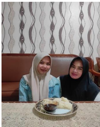
Gambar 2. Foto Wawancara