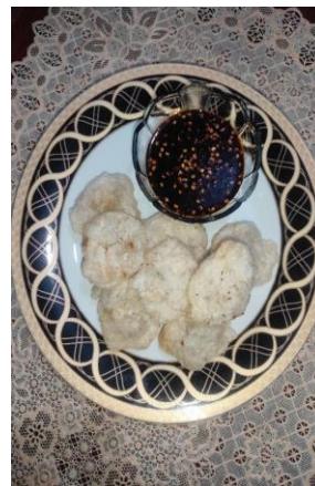
Gambar 3. Foto Produk