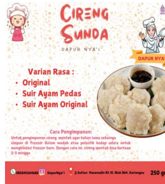
Gambar 5. Desain Tampilan

Visual berupa gambar cireng yang terlihat tekstur luar yang renyah dan sambal yang sangat menggugah selera makan beserta memberikan informasi mengenai varian rasa yang membuat pelanggan memudahkan untuk mengetahui varian rasa. Menampilkan nama “ Cireng Sunda “ yang mencerminkan makanan tradisional khas sunda dan memudahkan konsumen mengingat produk dari cireng sunda itu sendiri.