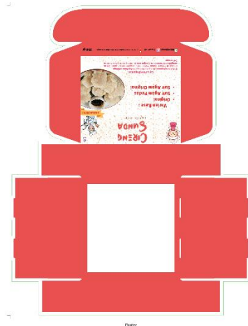
Gambar 7. Desain Akhir Packaging