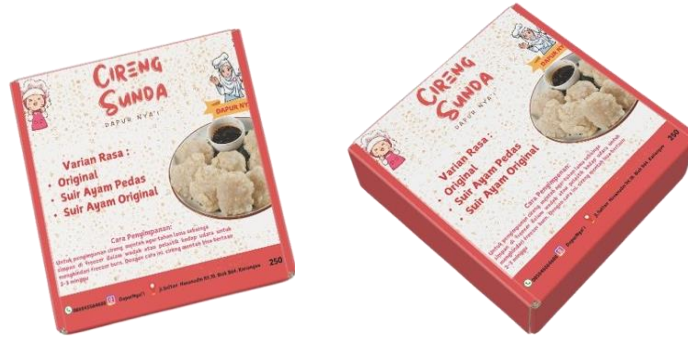
Gambar 8: Cetak Kemasan Cireng